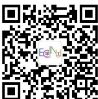
华东师范大学党委学 生(研究生)工作部 华东师范大学学生(研 究生)工作处