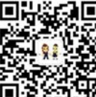
华东师范大学 保卫处