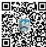
华东师范大学 (企业号)