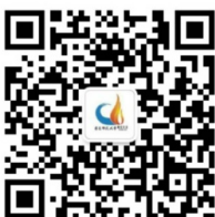
华东师范大学 研究生会