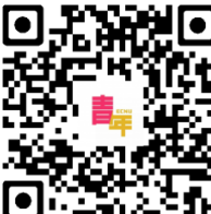
华东师范大学 团委