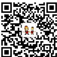
华东师范大学 研究生招生办公室