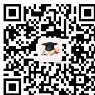
华东师范大学 研究生院