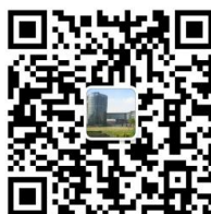
华东师范大学 图书馆